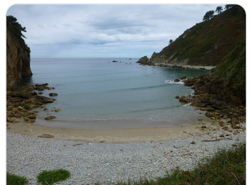
Playa de Xilo