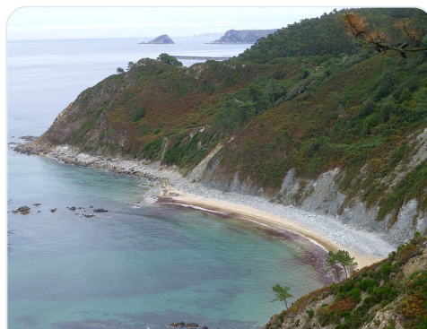
Playa de Las Llanas