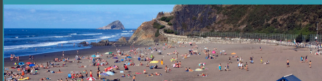
Playa de Los Quebrantos, al este el Playón de Bayas y la Isla de Deva