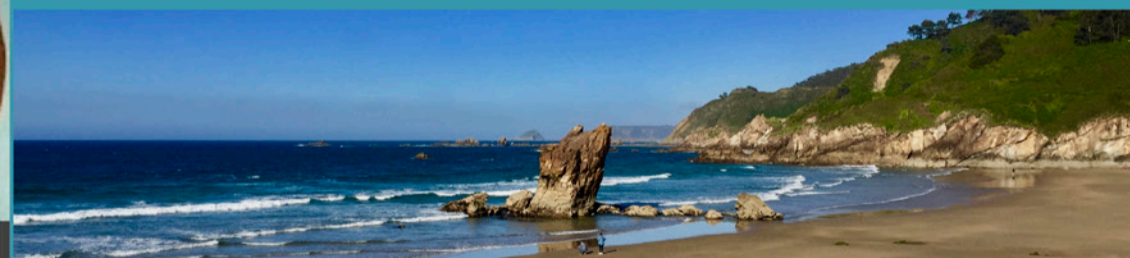
Playa de Aguilar, con la Xana del Caballar en primer término

Las maravillosas Playa de Aguilar cerca de Muros de Nalón y la Playa de Los Quebrantos en L'Arena, que forma con el contiguo y salvaje Playón de Bayas un extenso arenal de más de 4 km. de longitud, cuentan con todos los servicios y son de las más concurridas de Asturias en la época estival, pero los amantes del mar no deberían perderse el encanto y la tranquilidad de otras playas y calas más tranquilas y recónditas como El Garruncho , Las Llanas , Xan Xún o la playa de Xilo . En el espigón de la ría, se encuentran además las Piscinas de Agua de Mar de San Esteban .