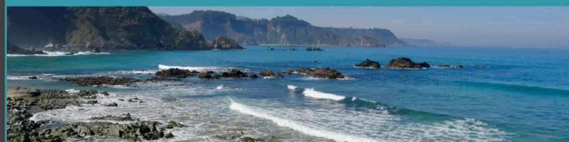
Playa de Las Llanas desde el Mirador de los Glays